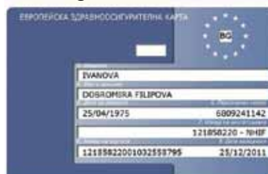
Eine bulgarische EHIC: