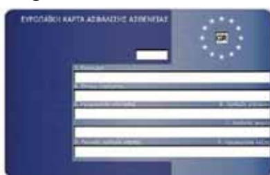
Eine griechische EHIC: