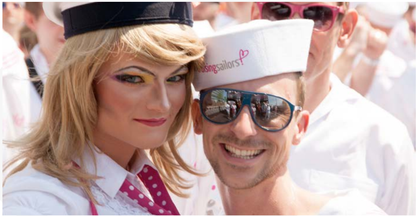
Cruising Sailors, CSD Köln, 2013