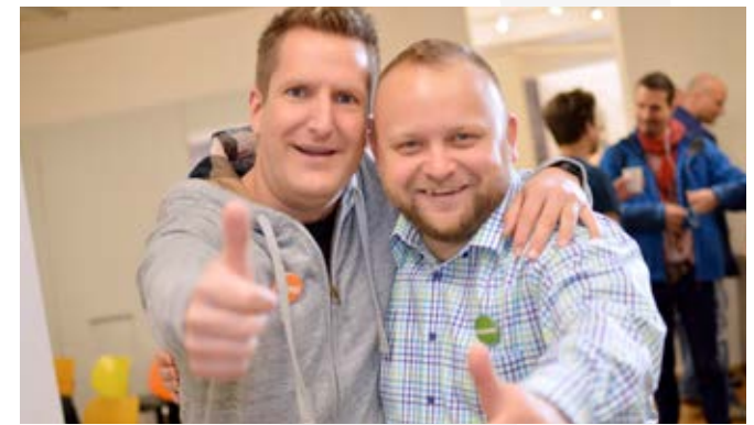
Runder Tisch kreathiv – präventiv 2014, Köln