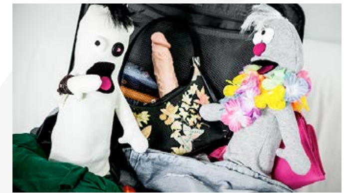
Socke & Schuss, 2015