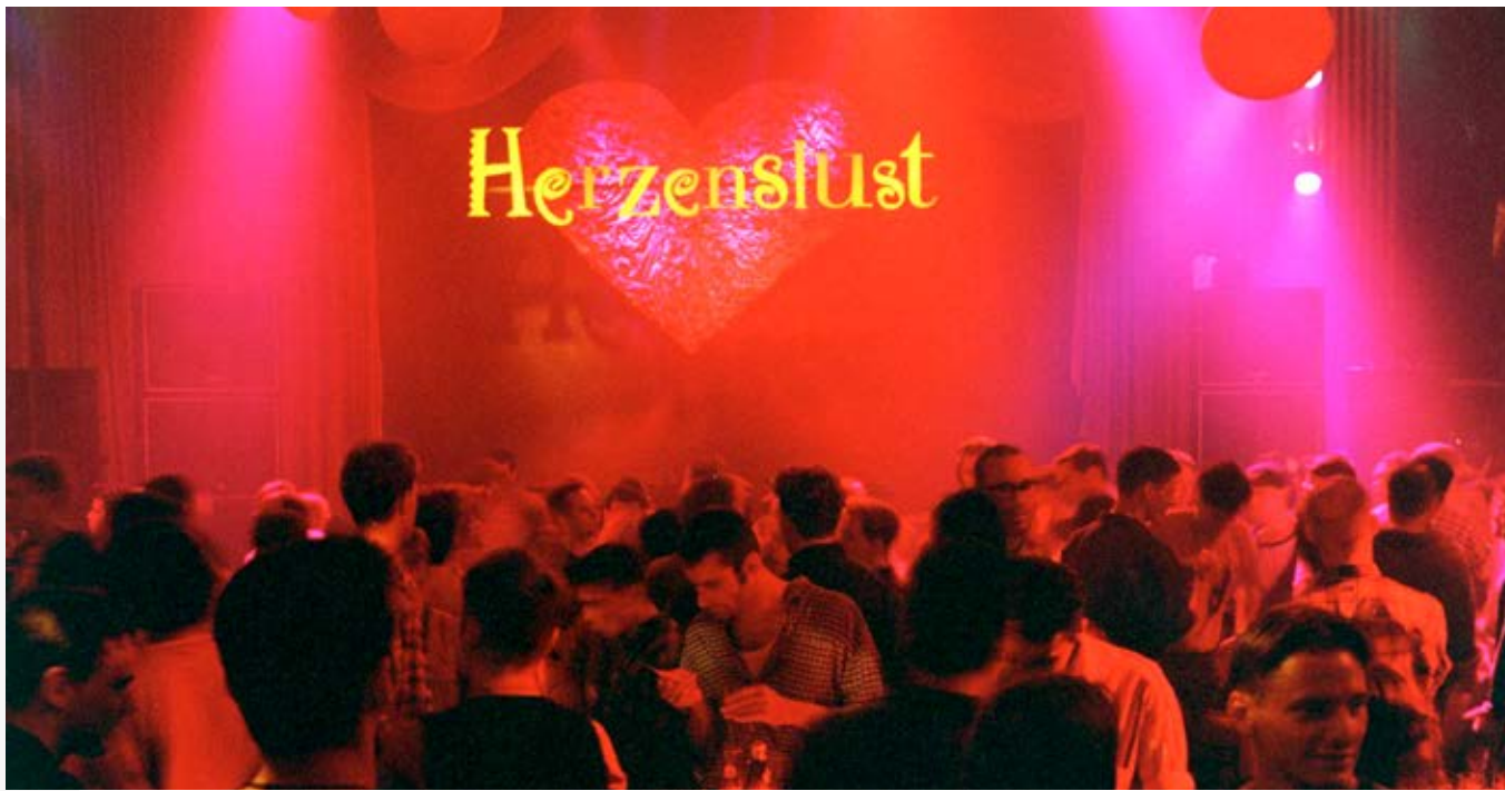
Auftakt Herzenslust-Kampagne im Gloria, 1995, Köln

Wir wollten mit Herzenslust nicht nur primärpräventive Botschaften vermitteln. Der Bereich, den wir strukturelle Prävention nennen, war für uns immer genauso wichtig. Dass man Bedingungen schafft und vorfindet, in denen Präventionsarbeit überhaupt möglich ist. Wir haben uns deshalb mit dem Älterwerden in der Community auseinandergesetzt oder vor etwa 15 Jahren bei der Zukunftsfabrik watch out... and dream schwulen Jugendlichen die Möglichkeit gegeben, mal darüber nachzudenken, wie ihre Zukunft in der Community aussieht. Da kamen so Ideen wie „Wir brauchen eigene schwul-lesbische Jugendzentren“. Das war im Prinzip der Anstoß zur Gründung des anyway in Köln und der anderen fünf schwul-lesbischen Jugendzentren, die es heute in NRW gibt.