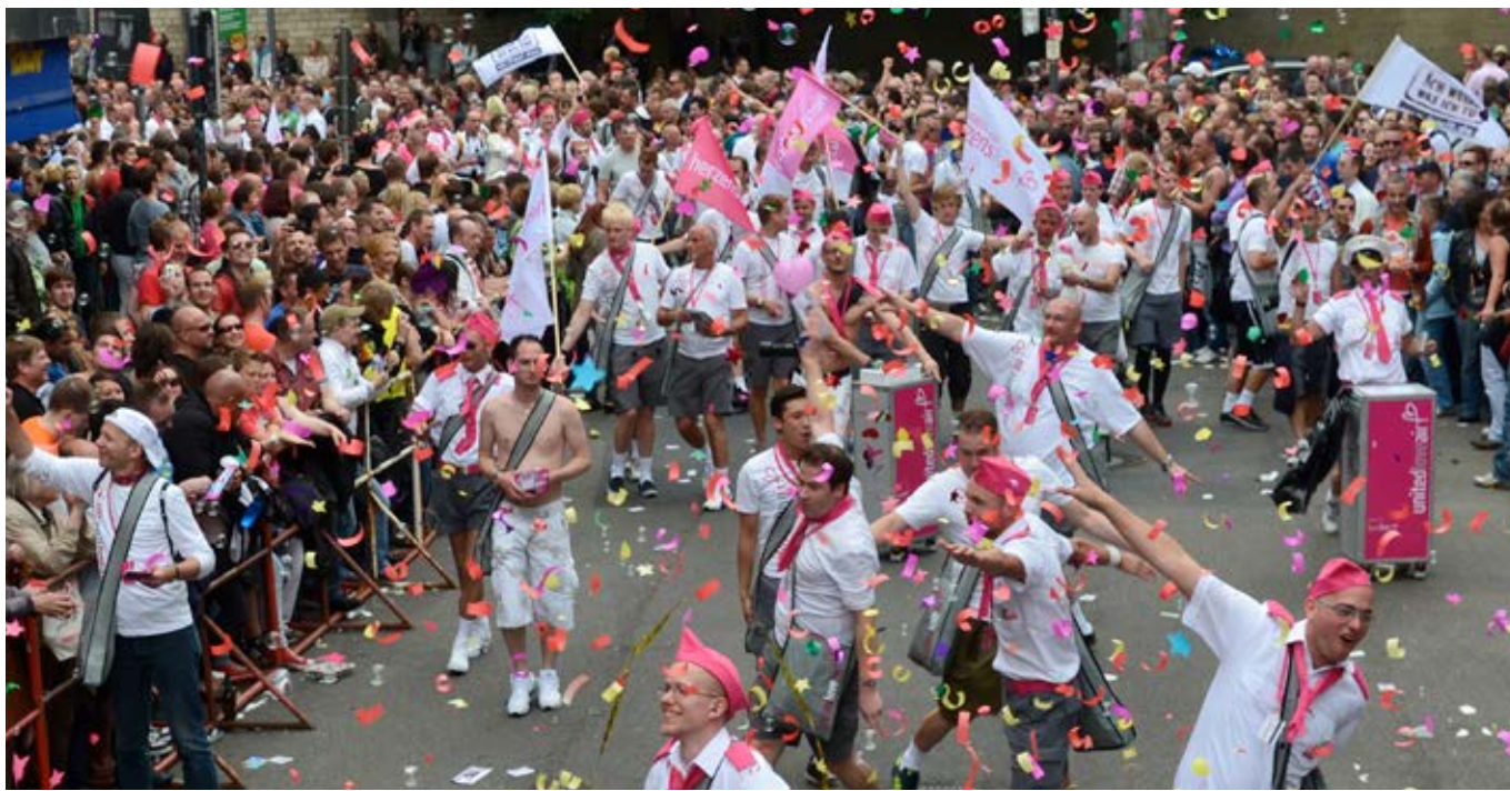
United Love Air, CSD Köln, 2011