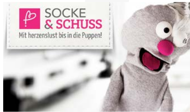
Socke & Schuss, 2015

Patrick Dörfler: Wir schauen uns ganz genau an, auf welche Themen die Leute anspringen und auf welche weniger. Die Redaktionsplanung wird immer wieder angepasst, um die Reichweite zu erhalten und auszubauen.