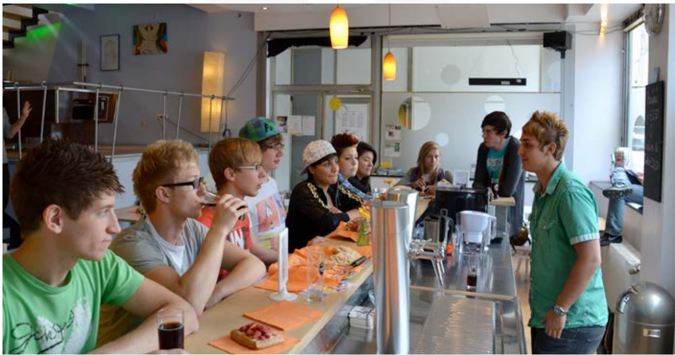
anyway Köln, 2011