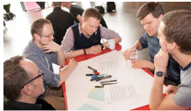
Runder Tisch kreathiv – präventhiv 2013, Köln

Herzenslust fördert die Selbstorganisation und deren Infrastrukturen, Selbstbewusstsein und Akzeptanz der gesellschaft-