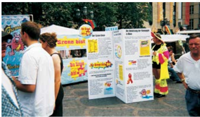
Die Szene bist du, 2001

Ich fordere von der Politik inhaltliche und finanzielle Bekenntnisse zur Herzenslust-Arbeit. Wie entwickeln wir kultursensible Angebote oder wie erreichen wir schwule Männer, die beim Sex Drogen konsumieren, sind aktuelle Fragen der Prävention. Wir müssen von der Politik geeignete Rahmenbedingungen erhalten, um diesen Herausforderungen mit aller Qualität begegnen zu können.