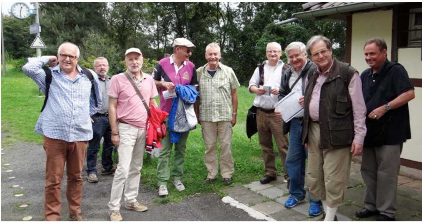
Golden Gays, 2014, Ahrweiler

Die daraus resultierenden Themen und relevanten Aufgaben sind vielfältig. Zum einen ist die Sensibilisierung ambulanter und stationärer Pflege sowie Betreuung für unterschiedliche Lebensformen, sexuelle Vielfalt oder Leben mit HIV dringend erforderlich. Aber auch die Unterstützung der Bildung sozialer Netzwerke der schwulen Community, die einen würdevollen Umgang mit Krankheit, Pflege und Tod ermöglichen, darf nicht vernachlässigt werden und der Dialog zwischen jüngeren und älteren schwulen Männern muss gefördert werden. Ebenso müssen die politischen, gesellschaftlichen und finanziellen Rahmenbedingungen geschaffen werden, die dies unter Beachtung der Besonderheiten schwuler Lebenswelten ermöglichen.