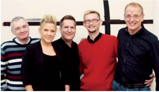
Vorstand der Aidshilfe NRW e.V.