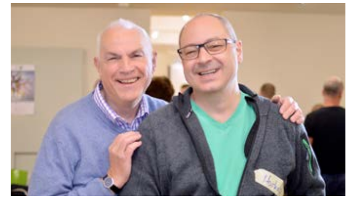
Runder Tisch kreathiv – präventiv 2014, Köln