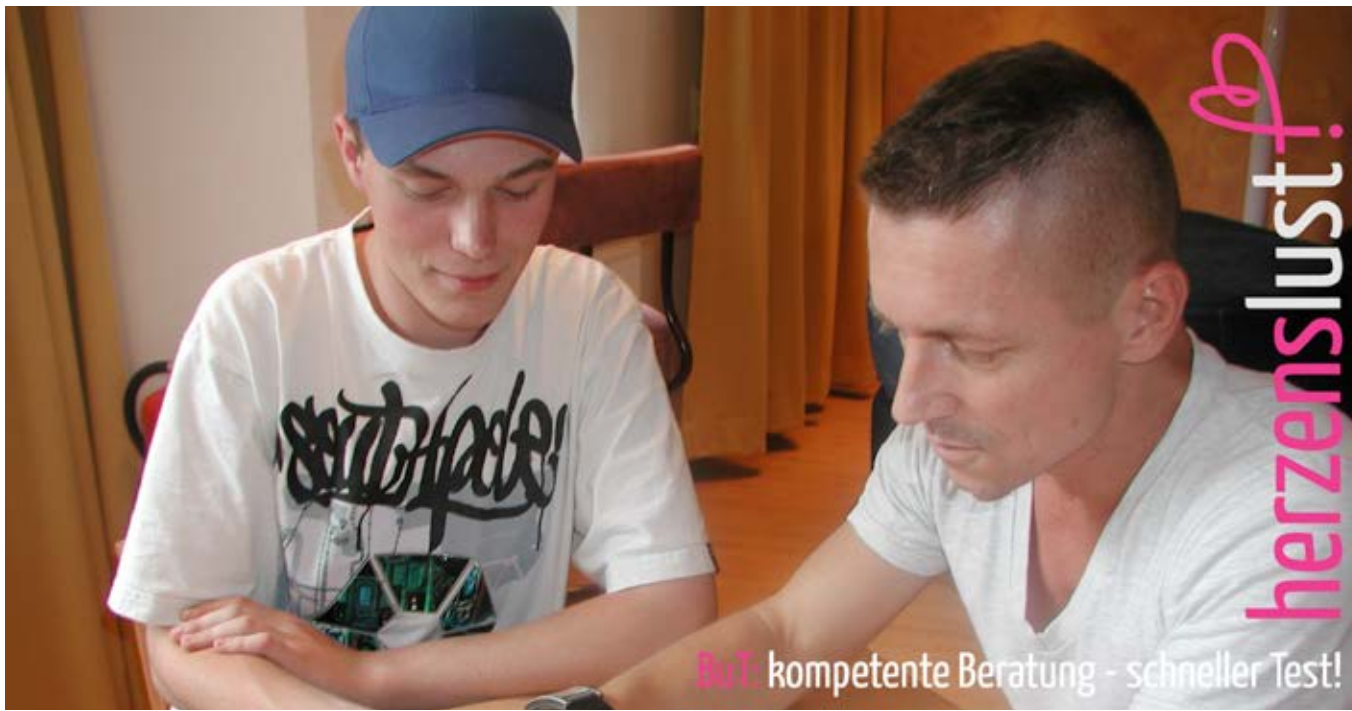
Ankündigung Beratung und Test, 2009

Auch in anderen Städten werden ähnliche Modelle bereits angeboten, werden ausgebaut oder sind in Planung. Ziel ist es, niedrigschwellig der primären Zielgruppe zu allen Fragen der schwulen (Männer-) Gesundheit Informationen, Beratung, Tests auf HIV und andere STI sowie perspektivisch auch medizinische wie therapeutische Behandlung anzubieten.