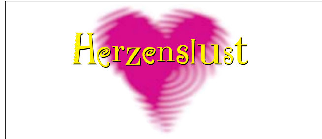
Herzenslust-Logo 1995 – 2008

Die erste Homepage ging 1997 online. Im Jahr 2004 erfolgte der erste Relaunch der Website herzenslust.de . Hier wurden die Themen und Inhalte des Herzenslust-Onlineprojekts Rein ins Vergnügen wieder in den Onlineauftritt der Kampagne integriert. Im Rahmen des Kampagnenrelaunchs 2008 wurde auch die Internetpräsenz neu konzipiert. Der gesamte Bereich der Onlinekommunikation wird kontinuierlich erweitert und ausgebaut, sei es mit dem Onlinenewsletter von Herzenslust oder den unterschiedlichen Facebookprofilen der Kampagne.