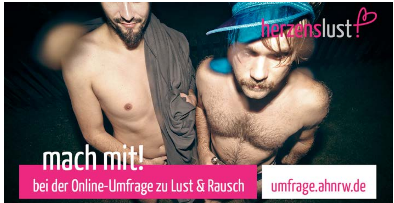
Online Umfrage Lust und Rausch, 2014

Andreas Bellmunt: Prävention darf sich nicht auf HIV beschränken, sondern muss auch Kenntnisse über alle anderen sexuell übertragbaren Erkrankungen vermitteln. Man muss zum Beispiel lernen, dass man sich immer wieder mit einer Syphilis oder mit Hepatitis C anstecken kann. So entsteht erst ein rundes Bild.