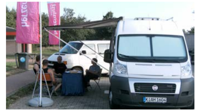
Beratung und Test, Duisburg / Kreis Wesel, 2009

Martin Ocepek: Das sind die vielfältigen Angebote, Spieleabende, Gruppen für schwule Väter wie für Menschen mit einer körperlichen Behinderung, für die älteren Schwulen oder für Schwule über 30. Das Café [iks] und das Essen-X-Point sind Bindeglieder zur