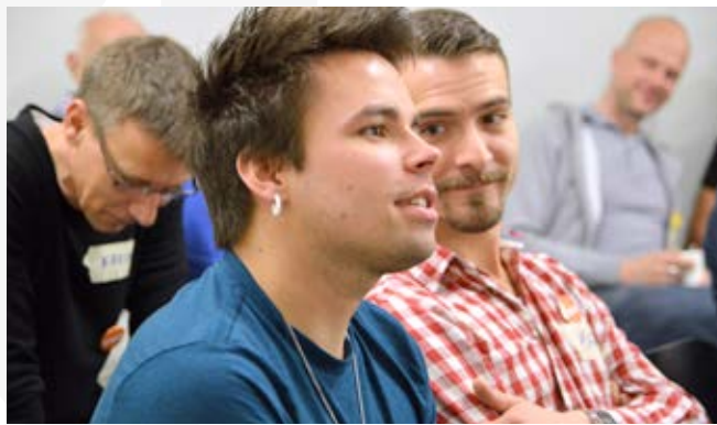
Runder Tisch kreathiv – präventhiv 2014, Köln