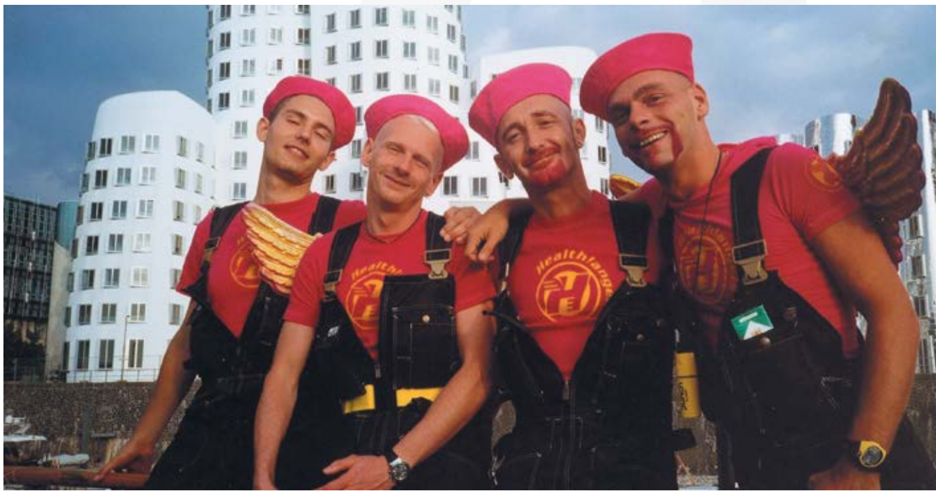
Healthlangels, 2003, Düsseldorf