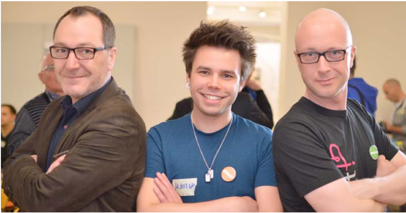
Runder Tisch kreathiv – präventiv 2014, Köln

Herzenslust wird nicht müde, die Politik aufzufordern, sich schwulen Lebensrealitäten zu stellen und diese Lebenswelten auch in ihrer Heterogenität wertzuschätzen. In Zeiten, in denen Stimmen wieder verstärkt Gehör finden, die Homosexualität als Normabweichung brandmarken, braucht es eine besondere Aufmerksamkeit und Sensibilität für eine aktive Minderheitenpolitik.