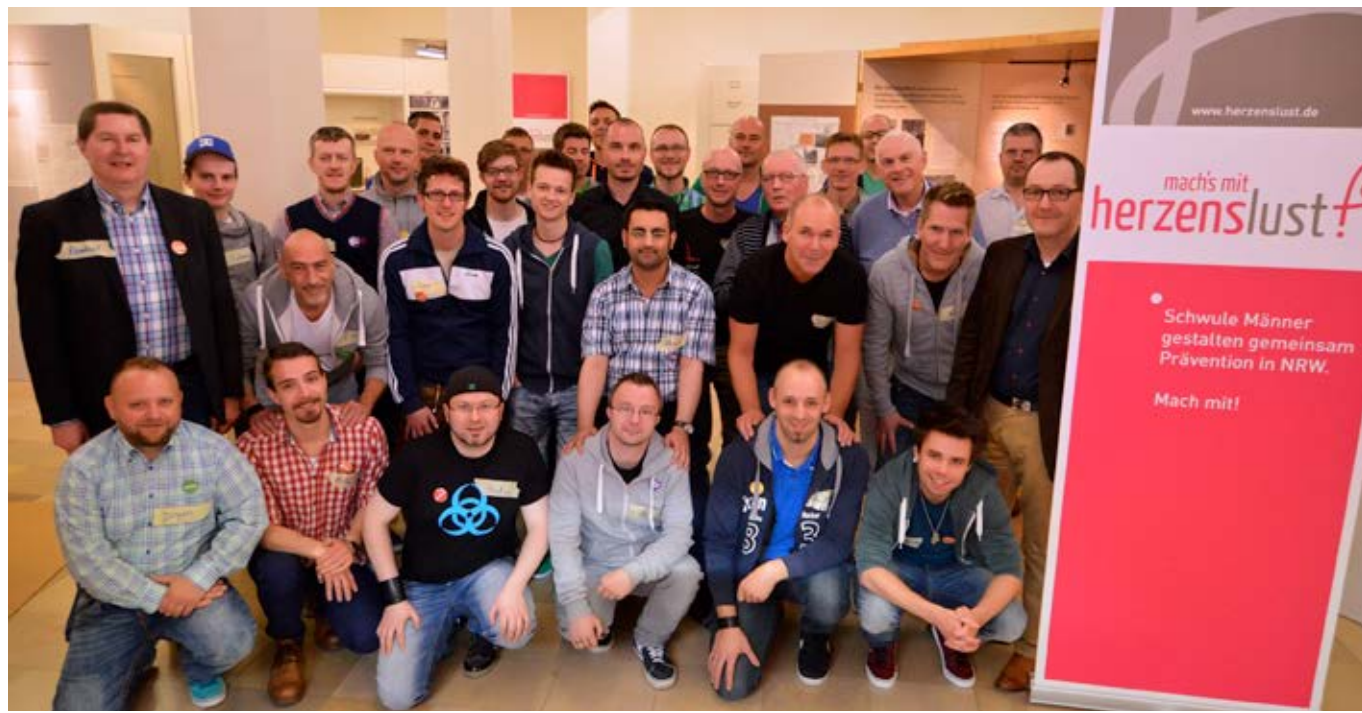
Runder Tisch kreathiv – präventiv 2014, Köln