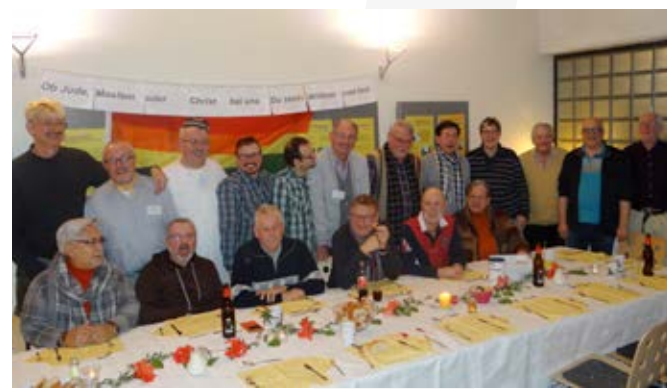
Golden Gays, Rubicon Neujahrskochen, 2015, Köln

Georg Roth: Eine Menge. Es sind ja damals eine ganze Reihe von Gruppen entstanden, hier in Köln, in Düsseldorf, Dortmund,