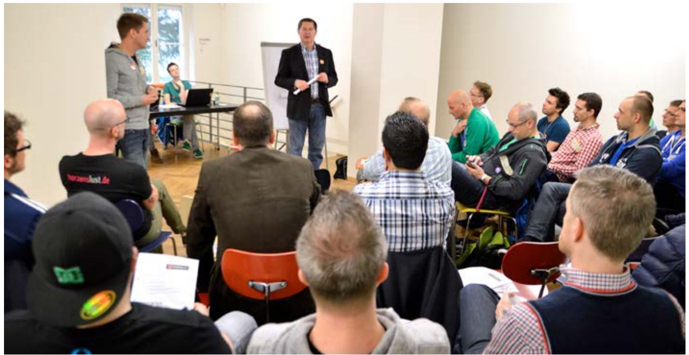
Runder Tisch kreathiv –präventiv 2014, Köln