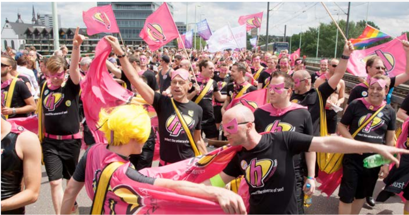
Herzenslust-Heroes, CSD Köln, 2014

Aber vor allem sind es in Köln die schwule Gesundheitsagentur Check Up (seit 01.01.2015 der neue CHECKPOINT 2015 ) der Aidshilfe Köln, die Beratungsstelle Rubicon und das Jugendzentrum anyway , die kontinuierlich und das ganze Jahr über in dieser Großstadt mit Herzenslust im Einsatz sind. Die ehren- und hauptamtlichen Mitarbeiter des Herzenslust-Teams von Check Up sind in der schwulen Szene bekannt. Sie sind in Bars ebenso wie in der Sauna, im Fetischclub oder in den Cruisinggebieten unterwegs und bringen ihre Präventionsthemen ohne erhobenen Zeigefinger an den Mann. Mit humorvollen Aktionen und hin und wieder auch in auffälligen Outfits werben sie um die Aufmerksamkeit der Gäste und setzen Impulse, sich mit Fragen zur eigenen sexuellen Gesundheit zu befassen. Die Mischung macht es eben: Eine gelungene Kombination aus Präventainment und kompetenter Beratung zu schwulem Leben und aktuellen Themen und Fragen der Prävention von HIV und anderen STI ist der Garant für die erfolgreiche Arbeit.