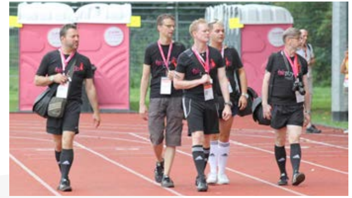
Gay Games, 2010, Köln