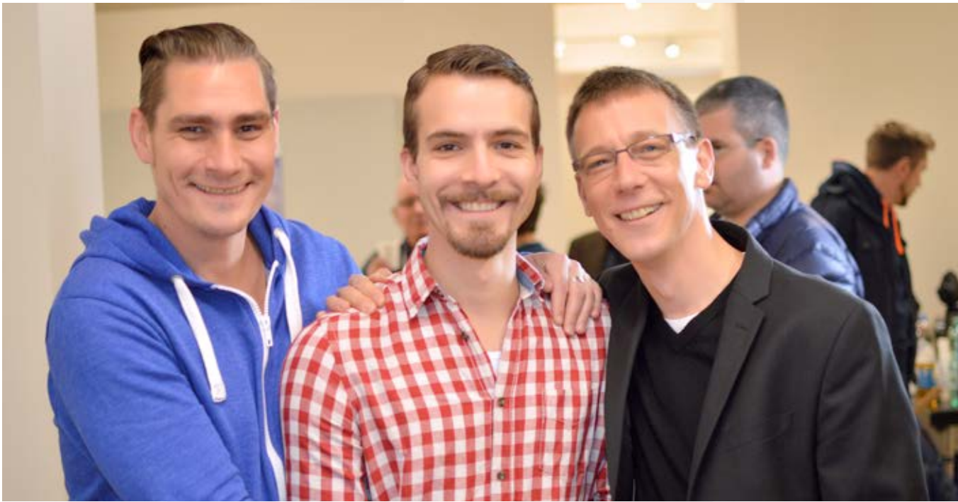
Runder Tisch kreathiv – präventiv 2014, Köln

Da Safer Sex heute weit über die Frage der Benutzung von Kondomen hinausgeht, wird Präventionsarbeit beratungsintensiver werden, die Nutzung verschiedener Informationskanäle aufwendiger und auch die Zusammenarbeit mit weiteren Akteuren im Feld schwuler Selbstorganisation und schwuler Gesundheit differenzierter. Gemeinsam arbeiten wir auch künftig gegen Diskriminierung, Stigmatisierung und Kriminalisierung. So dürfen etwa HIV-Positive auch in Zukunft keineswegs als Präventionsversager gebrandmarkt werden. Es gilt, die komplexeren Präventionsbotschaften auch weiterhin auf eine Weise zu kommunizieren, die neugierig und Lust auf die persönliche Reflexion eigenen Verhaltens macht.