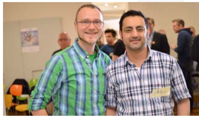
Runder Tisch kreathiv – präventiv, 2014, Köln