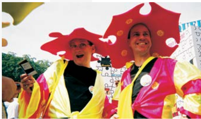
Die Szene bist du, 2001