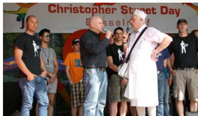
CSD Düsseldorf, 2010