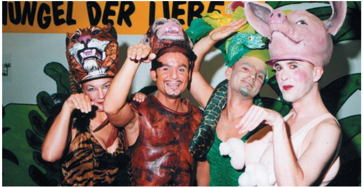
Dschungel der Liebe, CSD Köln, 1999

Ich hoffe mal sehr, dass es Herzenslust mit diesen Aufgaben in 20 Jahren nicht mehr geben muss, aber dass sich die Methode Herzenslust fortsetzt, in anderen Zusammenhängen, in anderen schwulen Lebenswelten.