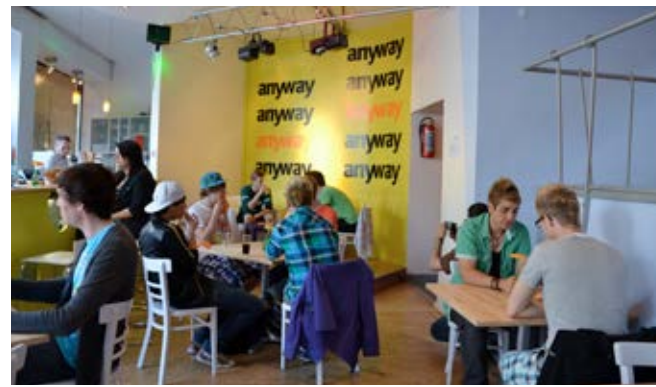
anyway Köln, 2011

Medienprojekte wie die JuPo -Filme (jung und positiv) oder Präventionsspots des anyway wurden aus ZSP-Mitteln mit Herzenslust gefördert. Die Webserie Julian (Junge Liebe anders)