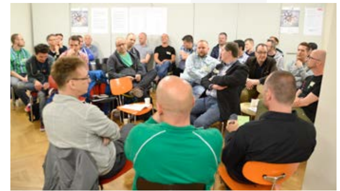
Runder Tisch kreathiv – präventhiv 2014, Köln